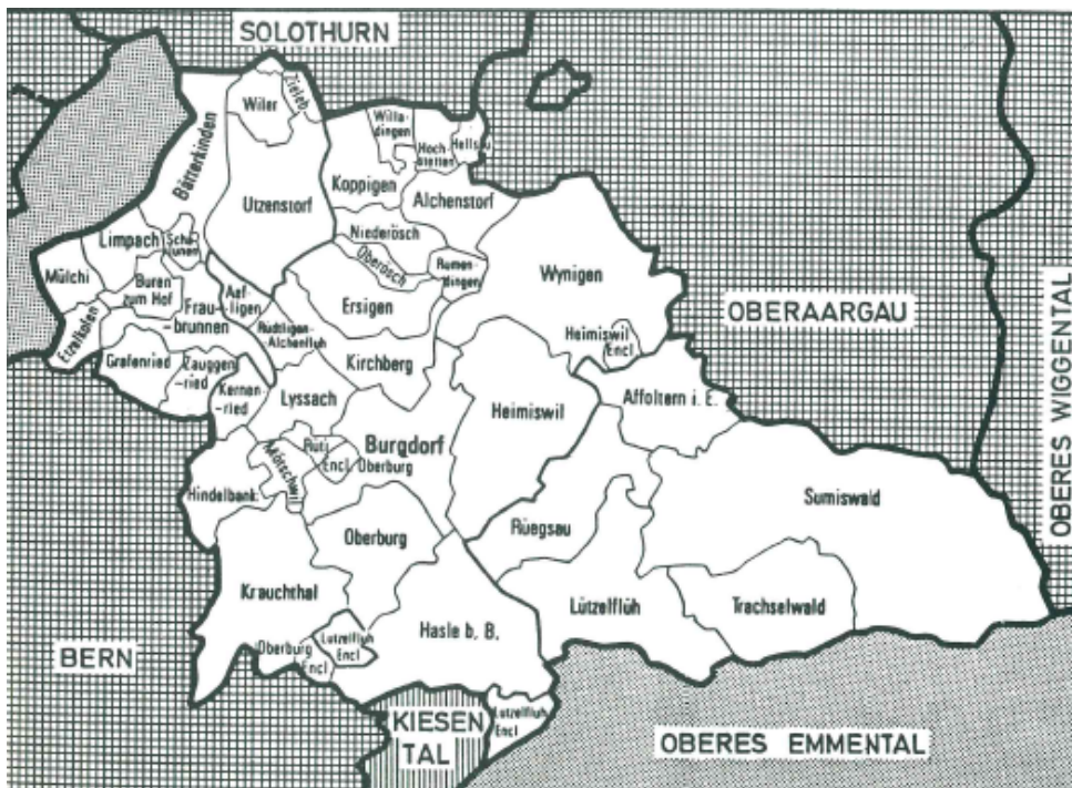
Karte aus der Chronik der MCI